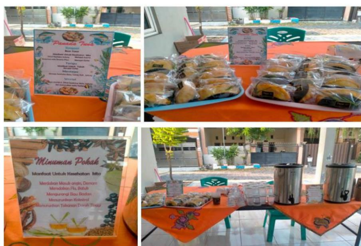
Gambar 2. PMT pada pertemuan Posyandu Lansia Nirmala

Pemberian Makanan Tambahan (PMT) dilakukan pada saat pertemuan rutin Posyandu Lansia Nirmala yang dilakukan sebulan sekali. Pada bulan September, untuk menu PMT adalah puding buah ceria dan pada bulan Oktober menu PMT adalah Panada Ikan Tuna dengan minuman Pokak. Kesemuanya memiliki nilai gizi yang tinggi. Paparan nilai gizi dilakukan didepan para anggota lansia beserta manfaatnya (Damayanti, 2020).