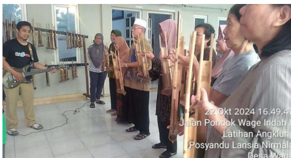
Gambar 1. Latihan angklung bersama anggota posyandu lansia Nirmala Wage

Kegiatan ini dilakukan dengan memanggil seorang pelatih angklung eksternal. Latihan dilakukan tiap minggu, tiap hari Selasa. Sebanyak 63.6% lansia merasa sangat senang dan 31.8% senang dengan mengikuti program angklung ini. Anggota lansia dibagi menjadi 3 kelompok dimana di awal ada 3 lagu yang akan dimainkan, yaitu Rek ayo Rek, Perahu layar dan Tombo Ati.