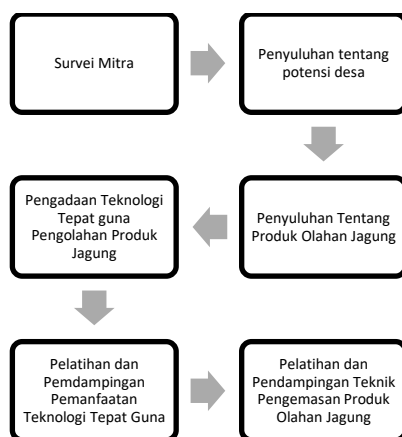
Gambar 3. Metode pengabdian

Berdasarkan gambar 3, diketahui metode pelaksanaan kegiatan pengabdian ini terdiri dari beberapa tahap, antara lain sebagai berikut: