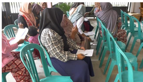
Gambar 5. Peserta mengerjakan pretes

Kegiatan pelatihan dilaksanakan pada bulan Agustus 2024 di Desa Bubulan, Kecamatan Bubulan, tepatnya di rumah ketua RT 04. Pelatihan dihadiri 20 orang peserta dari ibu-ibu PKK Desa Bubulan.