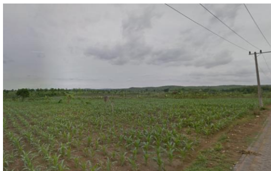
Gambar 1. Kondisi Hutan Ladang Jagung Desa Bubulan

Desa Bubulan yang terletak di Kabupaten Bojonegoro, Jawa Timur, merupakan sebuah wilayah yang berbatasan dengan desa dan kecamatan lain. Berdasarkan informasi dari situs resmi pemerintah Desa Bubulan, wilayah administrasinya mencakup luas sekitar 1.547 hektar terdiri dari 297 hektar untuk wilayah desa dan 1.250 hektar untuk wilayah hutan (Bubulan, 2016). Desa Bubulan adalah sebuah daerah yang dikenal sebagai daerah produsen tanaman pangan yang memiliki potensi tinggi. Terdapat dua panganan yang menjadi andalan didaerah ini yaitu padi dan jagung, Desa Bubulan memiliki sumbangsih terbesar dalam penghasil jagung dengan persentase 3,90% (Patiung, 2020). Namun kelompok PKK Desa Bubulan sebagai aktor pemberdayaan perempuan belum terlibat aktif dalam pengelolaan hasil panen agar dapat memiliki nilai tambah.