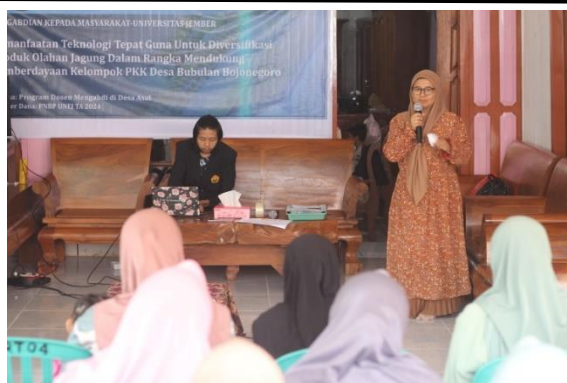
Gambar 6. Pemaparan Potensi Desa dan Penyuluhan Produk Olahan Jagung

Selanjutnya, sesi penyuluhan membahas manfaat jagung bagi kesehatan berdasarkan kandungan nutrisinya. Jagung mengandung berbagai nutrisi penting, seperti karbohidrat, protein, serat, serta beragam vitamin dan mineral yang bermanfaat bagi tubuh. Beberapa vitamin yang terkandung dalam jagung manis antara lain folat, vitamin A, vitamin C, dan vitamin B (Suharyati et al. , 2019). Kandungan nutrisi yang terdapat pada jagung menunjukkan bahwa jagung adalah tanaman yang memiliki banyak manfaat.