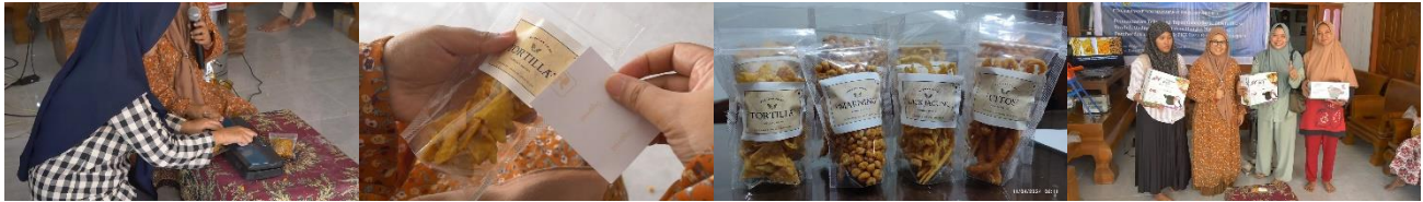
Gambar 8. Pelatihan dan pendampingan teknik pengemasan produk olahan jagung (dari kiri ke kanan): Pengenalan sealer ; Pelatihan pengemasan; Hasil produk; Pembagian doorprize

alat penggiling dan pemipih adonan hingga tipis, potong adonan menjadi potongan kecil, goreng hingga matang dan tiriskan minyak menggunakan alat peniris minyak (Alam et al, 2023).