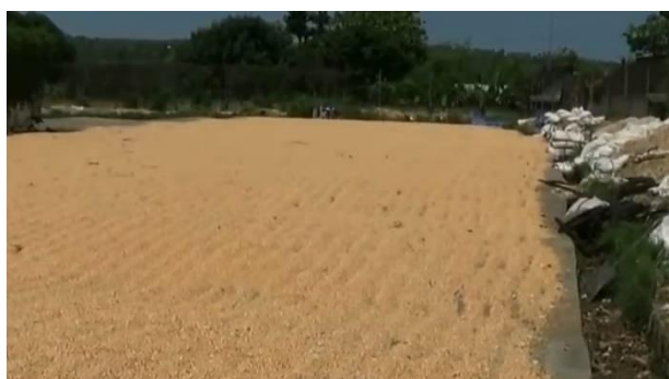
Gambar 2. Pengeringan Biji Jagung

Desa Bubulan yang terletak di Kabupaten Bojonegoro, Jawa Timur, merupakan sebuah wilayah yang berbatasan dengan desa dan kecamatan lain. Berdasarkan informasi dari situs resmi pemerintah Desa Bubulan, wilayah administrasinya mencakup luas sekitar 1.547 hektar terdiri dari 297 hektar untuk wilayah desa dan 1.250 hektar untuk wilayah hutan (Bubulan, 2016). Desa Bubulan adalah sebuah daerah yang dikenal sebagai daerah produsen tanaman pangan yang memiliki potensi tinggi. Terdapat dua panganan yang menjadi andalan didaerah ini yaitu padi dan jagung, Desa Bubulan memiliki sumbangsih terbesar dalam penghasil jagung dengan persentase 3,90% (Patiung, 2020). Namun kelompok PKK Desa Bubulan sebagai aktor pemberdayaan perempuan belum terlibat aktif dalam pengelolaan hasil panen agar dapat memiliki nilai tambah.