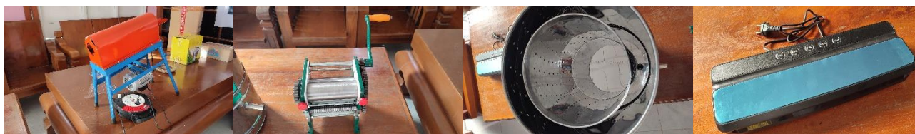
Gambar 4. Teknologi Tepat Guna untuk Produksi Produk Olahan Jagung (dari kiri ke kanan): Pemipil jagung; Alat penggilas dan pemipih adonan; Peniris minyak; Sealer.