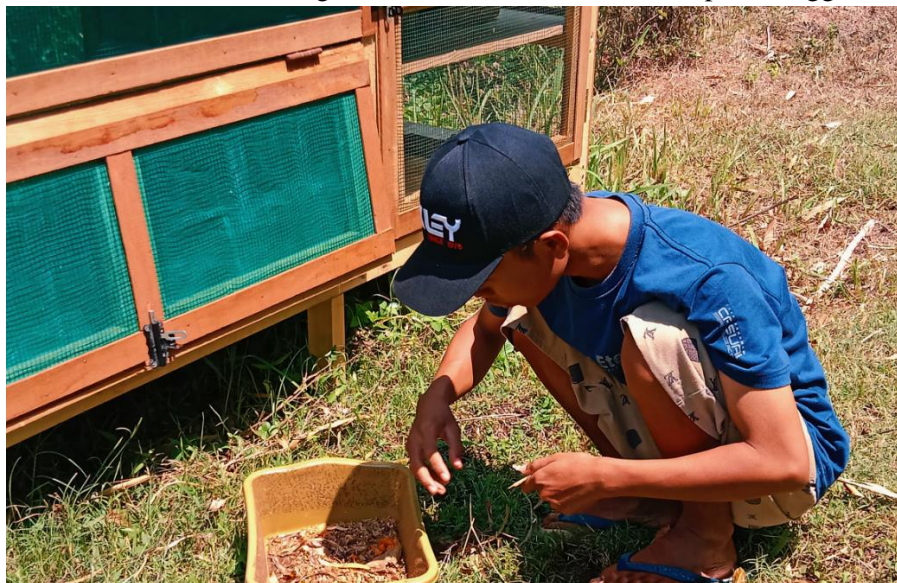
Gambar 4. Praktik Kader Muda Merawat Maggot Supaya Dapat Mengolah Sampah Organik