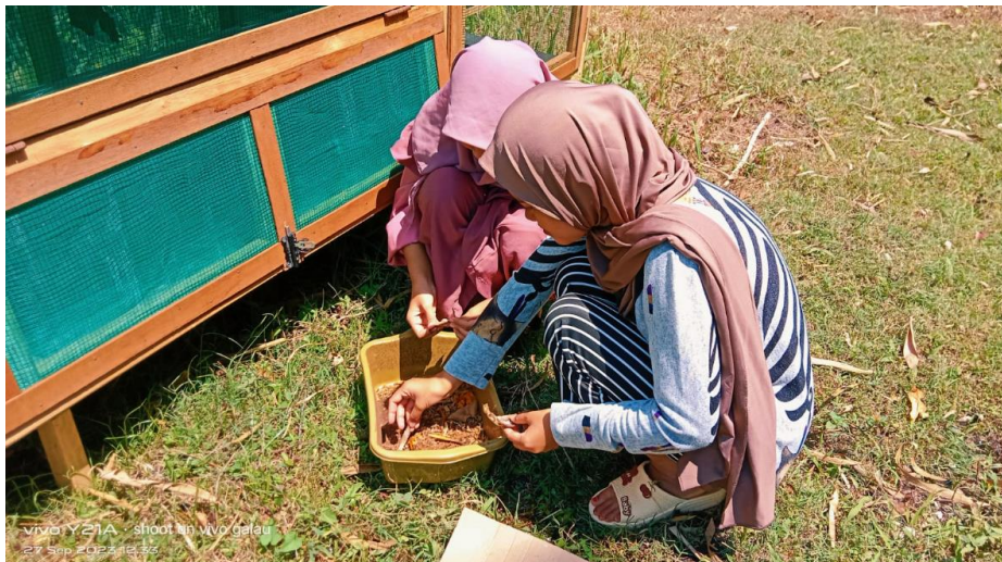
Gambar 3. Praktik bagi Kader Muda Memberi Makan pada Maggot