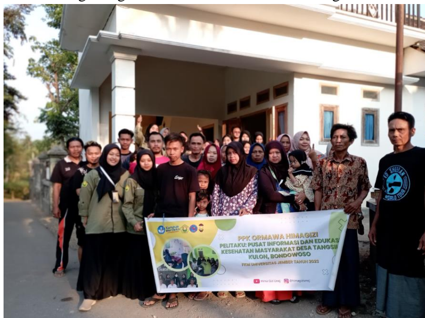
Gambar 2. Kegiatan Sosialisasi Pengolahan Sampah Di Rumah Warga di Desa Tangsil Kulon

Sebelum tahapan sosialisasi program kegiatan dilakukan, tim Fasilitator dari Ormawa Himagizi dan Hima Tehnik Lingkungan melakukan pengajuan dan perizinan kegiatan yang dilaksanakan di Balai Desa Tangsil Kulon dengan menenui Bapak Kepala Desa sekaligus perwakilan dari Kepala Dusun dari lokasi tim melaksanakan kegiatan. Diskusi tersebut dilakukan untuk membahas program kegiatan yang dilakukan dan apa saja dari tim fasilitator dari Ormawa Himagizi dan Tim Hima Tehnik Lingkungan dalam persiapan terkait program Pengelolaan sampah serta sasaran sosialisasi yang terdiri dari kader muda desa (Generasi Z), warga Desa Tangsil Kulon khususnya yang memiliki ternak dan limbah ternaknya belum dikelola dengan baik serta dari Ibu-ibu kader sebagai sasaran dari keluarga yang menghasilkan sampah organik di rumah tangga. Kegiatan ini disambut baik oleh Bapak Kepala Desa dan beliau juga menyatakan bahwasanya program pengelolaan sampah ini penting untuk dilakukan di masyarakat Desa Tangsil Kulon. Tim juga mendiskusikan terkait keberlanjutan program yang nantinya akan menjadi program kegiatan rutin yang dipimpin oleh Kader Muda sebagai bagian dari Generasi Z di Desa Tangsil Kulon.