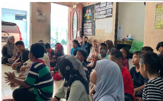
Gambar 4. Tim PkM KI melaksanakan Quiz Cahaya Iman