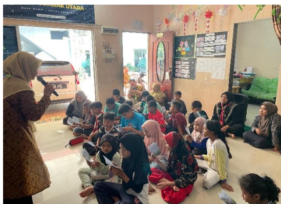
Gambar 1. Tim PkM KI menjelaskan Bahasa Arab

Pendekatan ini menekankan proses belajar yang menyenangkan, partisipatif, dan aplikatif. Dengan menggabungkan metode seperti direct method , audio-lingual , dan simulasi percakapan , anak-anak lebih cepat terbiasa dengan kosakata dasar yang relevan dengan kehidupan sehari-hari (Helwani, 2022). Data pre-test dan post-test menunjukkan adanya peningkatan keterampilan berbahasa, baik dari segi penguasaan kosakata maupun kemampuan membangun kalimat sederhana. Hal ini menguatkan temuan Briliandy & Inayati bahwa metode pembelajaran aktif lebih efektif meningkatkan kemampuan bahasa Arab mahasiswa, dan dapat diterapkan pula pada konteks pendidikan nonformal (Briliandy, N. R., & Inayati, 2024).