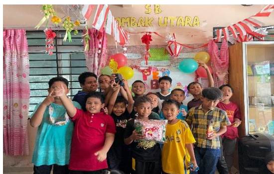
Gambar 5. Tim PkM KI Membagikan Hadiah Quiz Cahaya Iman

Pembelajaran Al-Qur'an ditekankan pada bacaan tartil, tajwid, serta hafalan surat-surat pendek. Efektivitas metode terlihat dari meningkatnya kemampuan membaca dengan benar serta bertambahnya hafalan surat peserta. Pendekatan ini bukan sekadar mengajarkan teknik membaca, melainkan juga internalisasi nilai, karena anak-anak didorong memahami arti ayat-ayat yang dihafalkan