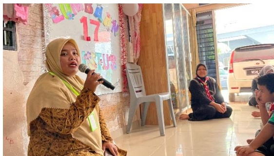
Gambar 2. Tim PkM KI Membuka Acara PkM KI

retensi kosakata dan membangun kepercayaan diri peserta dalam berkomunikasi (Kusuma et al., 2023).