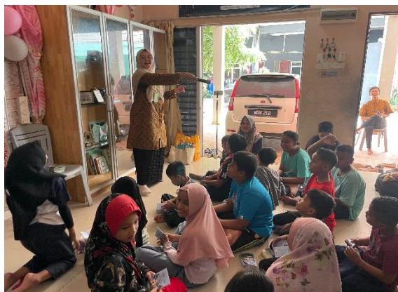
Gambar 3. Tim PkM Menjelaskan Materi Pelita Hikmah

Materi keislaman yang biasanya disampaikan secara dogmatis dikemas interaktif, misalnya melalui cerita, tanya jawab, dan praktik sederhana. Hasil evaluasi menunjukkan peningkatan pemahaman hingga 70% pada topik-topik dasar aqidah, adab sehari-hari, dan prinsip amar ma'ruf nahi munkar. Ini membuktikan bahwa metode andragogi (pendidikan berbasis pengalaman dan partisipasi) juga relevan untuk anak-anak, asalkan dikemas sederhana.