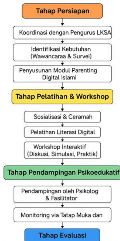
Gambar 1. Diagram Alur Kegiatan Pengabdian kepada Masyarakat