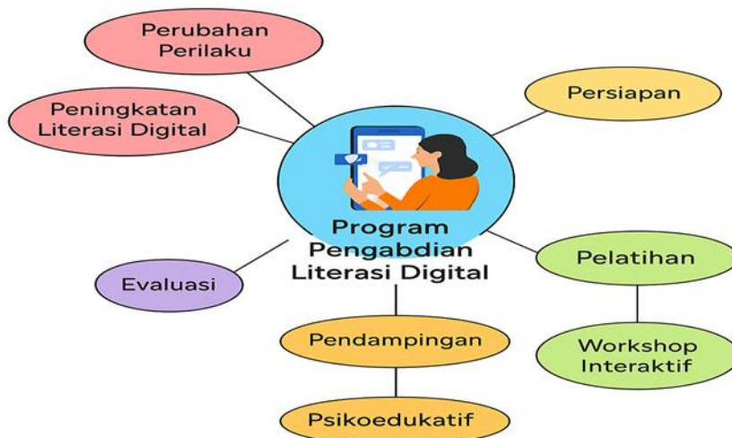
Gambar 4. Program Pengabdian Literasi Digital

Program di LKSA Ar-Ridlo secara implisit selaras dengan model hibrida ini, di mana pelatihan tatap muka dilengkapi dengan pendampingan daring melalui grup WhatsApp. Pendekatan ini memungkinkan orang tua untuk terus berbagi pengalaman, memecahkan masalah, dan saling mendukung, menciptakan ruang aman bagi mereka untuk terus belajar dan beradaptasi (Jäggi et al , 2024). Dengan demikian, keberlanjutan program tidak hanya bergantung pada pembaruan materi, tetapi pada penguatan jaringan sosial yang dibangun di dalam komunitas itu sendiri, menjadikannya sebuah model yang tangguh untuk intervensi di masa depan.