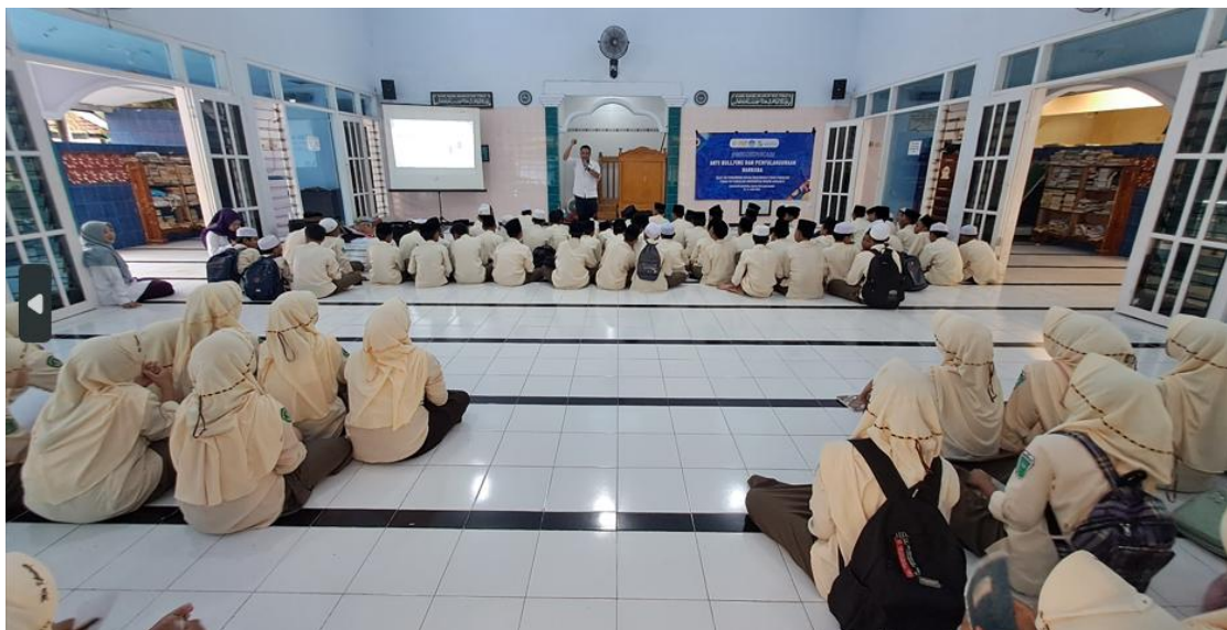
Gambar 4. Narasumber menyampaikan materi psikoedukasi

Kompleksitas tantangan dalam mengubah pengetahuan tentang bullying mengonfirmasi perlunya pendekatan yang lebih holistik untuk mencapai target SDG 4 mengenai pendidikan untuk pembangunan berkelanjutan dan gaya hidup yang damai. Ketidaksignifikan hasil pada aspek bullying mengindikasikan bahwa pendekatan single-session belum memadai untuk mengubah norma sosial yang menjadi akar kekerasan, yang juga menjadi fokus SDG 16.2 dalam mengakhiri kekerasan terhadap anak.