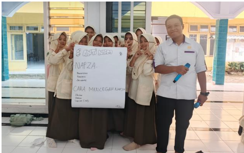
Gambar 3. Peserta kegiatan psikoedukasi membuat poster edukasi kampanye Anti-NAPZA

Temuan peningkatan pengetahuan anti-NAPZA menunjukkan kontribusi program terhadap target SDG 3, yaitu memperkuat pencegahan dan pengobatan penyalahgunaan zat adiktif. Meskipun ukuran efek tergolong kecil, peningkatan ini merupakan langkah awal yang kritis dalam membangun ketahanan remaja terhadap bahaya narkoba, yang sejalan dengan indikator kesehatan mental dalam SDG 3.4. Hal ini mengindikasikan bahwa materi mengenai jenis, dampak, dan bahaya penyalahgunaan zat adiktif berhasil diserap dengan baik oleh peserta. Efektivitas ini diduga kuat berkaitan dengan sifat materi NAPZA yang lebih faktual dan konkret, sehingga lebih mudah dipahami dan diinternalisasi oleh siswa usia remaja (Devi and Anwar, 2022). Metode diskusi interaktif, studi kasus dan praktik pembuatan poster yang diterapkan tampaknya cocok untuk menjelaskan konsep-konsep kesehatan yang bersifat teknis ini.