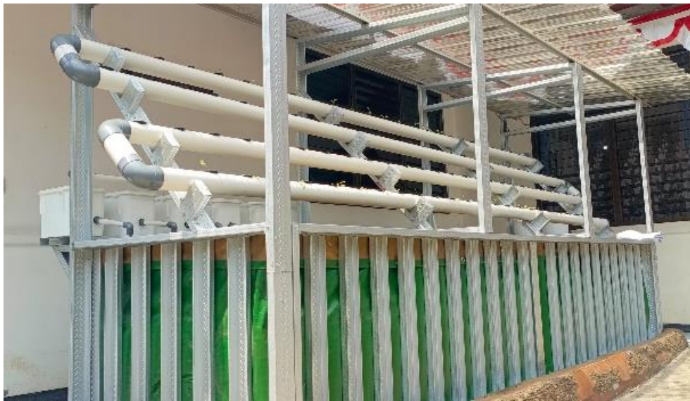
Gambar 4. Instalasi Sistem Aquaponik

Hasil identifikasi masalah berhasil mengungkap kebutuhan mitra akan solusi untuk meningkatkan ketahanan pangan dan potensi ekonomi melalui sistem akuaponik. Pembuatan akuaponik disesuaikan dengan luas lahan mitra. Pada tahap ini dihasilkan sistem akuaponik dengan prinsip Recirculating Aquaculture System yaitu air yang digunakan sebagai media budidaya dialirkan dengan menggunakan pompa menuju talang atau pipa pemeliharaan sayuran (Yustiati et al, 2024).