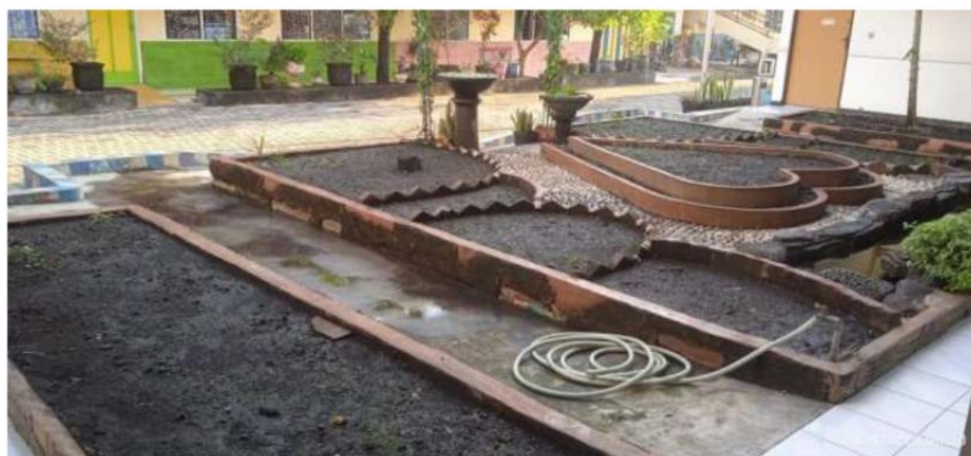
Gambar 2. Tampak Belakang Halaman Asrama di Yayasan Bhakti Luhur