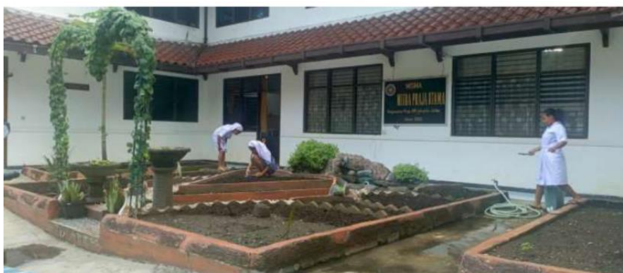
Gambar 1. Tampak Depan Halaman Asrama di Yayasan Bhakti Luhur