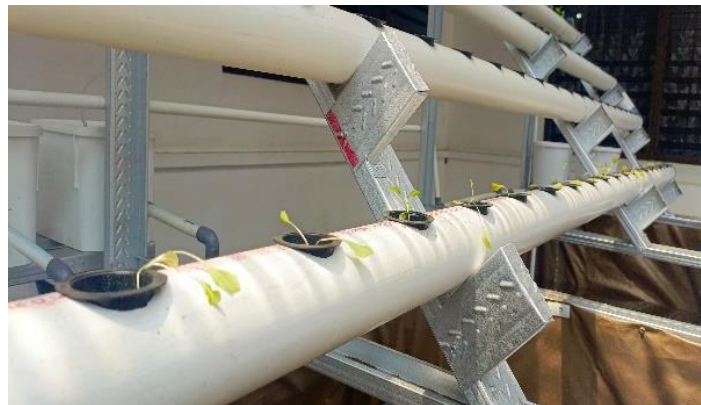
Gambar 6. Akuaponik dengan Sayuran Berdaun

Pertanian akuaponik yang menanam sayuran berdaun dan ikan telah menunjukkan keuntungan ekonomi yang jauh lebih tinggi daripada sistem tradisional yang berdiri sendiri. Petani akuaponik komersial terutama berfokus pada sayuran berdaun dan rempah-rempah, dengan kemangi, salad hijau, tomat, dan selada sebagai spesies yang paling umum dibudidayakan. Akuaponik air asin juga telah mendapatkan daya tarik, dengan tanaman seperti Salicornia persica yang tumbuh subur di lingkungan dengan kadar garam tinggi (Yep & Zheng, 2019).