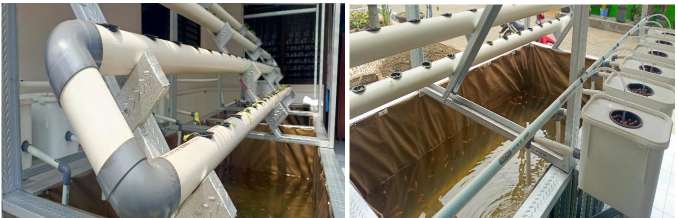
Gambar 5. Akuaponik dengan sistem akuakultur resirkulasi

Hasil identifikasi masalah berhasil mengungkap kebutuhan mitra akan solusi untuk meningkatkan ketahanan pangan dan potensi ekonomi melalui sistem akuaponik. Pembuatan akuaponik disesuaikan dengan luas lahan mitra. Pada tahap ini dihasilkan sistem akuaponik dengan prinsip Recirculating Aquaculture System yaitu air yang digunakan sebagai media budidaya dialirkan dengan menggunakan pompa menuju talang atau pipa pemeliharaan sayuran (Yustiati et al, 2024).