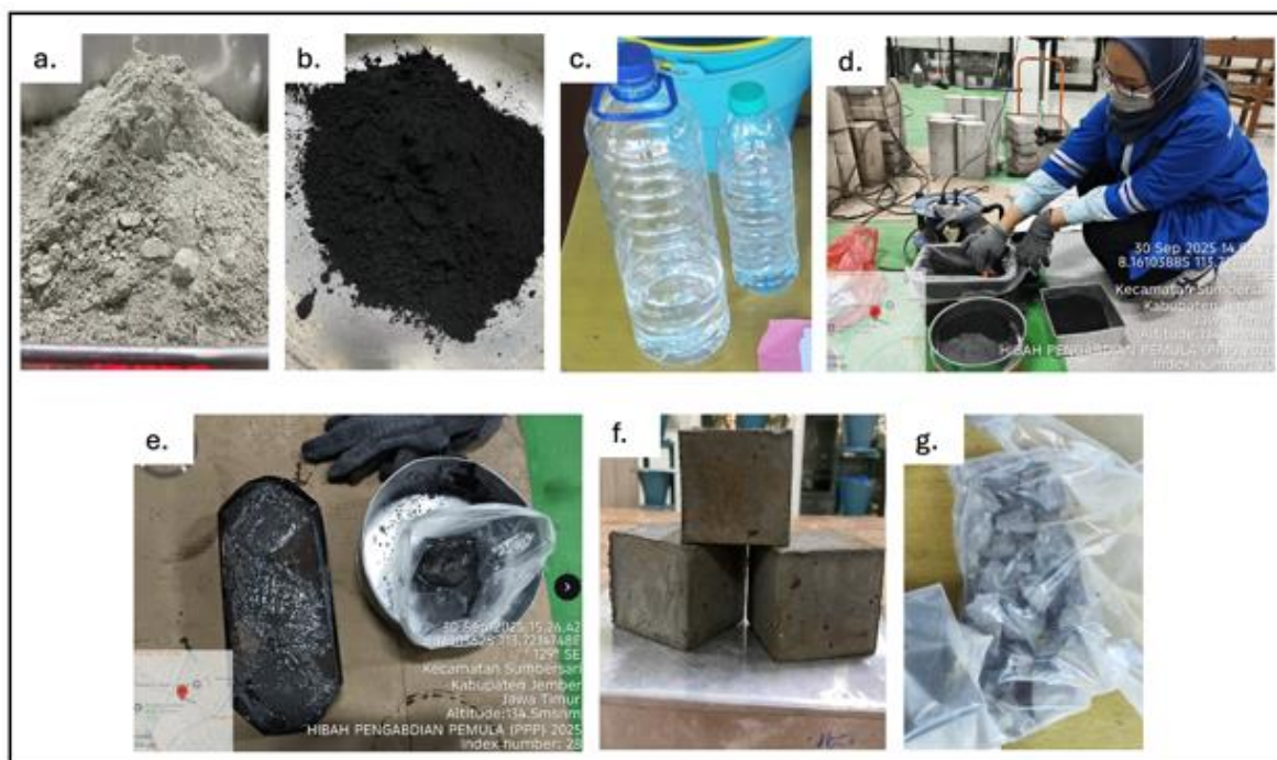
Gambar 4. Pembuatan Agregat Kasar Buatan Berbahan Abu Bonggol Jagung, a. Semen, b. Abu Bonggol Jagung, c. Air, d. Proses Pencampuran Material, e. Pasta yang dimasukkan kedalam cetakan, f. Sampel pasta yang sudah mengeras, g. Sampel agregat kasar buatan

Material yang digunakan untuk membuat agregat kasar buatan meliputi abu bonggol jagung, semen dan air. Prosentase abu bonggol jagung yang digunakan 5% dari berat semen dan kadar air 0,36%. Abu bonggol jagung dicampur kedalam semen kemudian diaduk hingga tercampur merata. Kemudian, air ditambahkan sedikit demi sedikit lalu aduk perlahan hingga homogen. Adonan yang sudah tercampur dimasukkan ke dalam cetakan atau mold . Setelah padat dan mengeras, keluarkan sampel dari cetakan atau mold . Untuk mendapatkan agregat kasar buatan, sampel dipecahkan menggunakan palu menjadi serpihan – serpihan kecil mirip seperti kerikil. Alur pencampuran dan pembuatan agregat kasar buatan dijelaskan pada gambar 4.