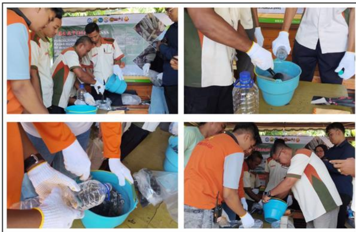
Gambar 7. Praktik langsung dalam proses pencampuran bahan yang akan digunakan menjadi agregat kasar buatan

Setelah sesi pemaparan materi, Tim juga memberikan praktik langsung dalam proses pembuatan agregat kasar buatan berbahan abu bonggol jagung. Tim memperkenalkan alat dan bahan yang digunakan selama proses pencampuran material. Peserta dibagi menjadi dua kelompok dan masing – masing kelompok diberi kesempatan untuk mencoba secara langsung dalam pembuatan sampel. Selama praktik berlangsung pada Gambar 7, peserta antusias dengan mencoba melakukan tahapan secara benar dan mengajukan pertanyaan apabila masih ada yang belum dipahami dalam proses pencampuran bahan.