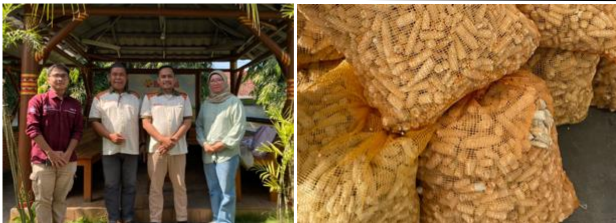
Gambar 2. Survei Lapangan dan Kordinasi dengan Mitra