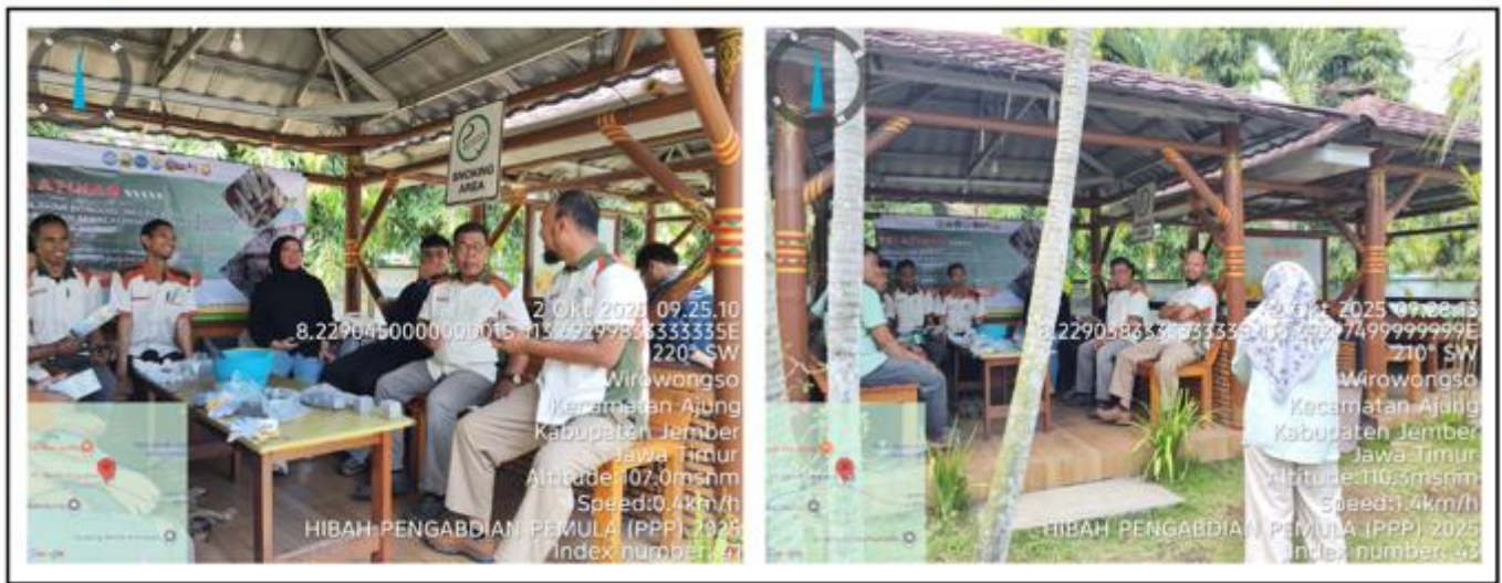
Gambar 8. Sesi Tanya Jawab bersama Peserta Pelatihan

Melalui kegiatan ini, peserta menanyakan terkait limbah apa saja yang dapat digunakan menjadi bahan dalam membuat agregat kasar buatan dalam campuran beton, Gambar 8. Selain itu peserta juga menanyakan terkait besaran biaya yang dikeluarkan dan dampak apa saja yang ditimbulkan jika dibandingkan dengan pembuatan beton secara konvensional. Melalui beberapa jurnal penelitian yang ada, pemanfaatan limbah pertanian sebagai bahan campuran beton tidak hanya bonggol jagung namun bisa juga menggunakan abu sekam padi. Akan tetapi karakteristik dari abu sekam padi tiap lokasi bisa berbeda sehingga perlu melakukan pengujian lebih lanjut terkait bahan tersebut. Selain itu untuk biaya produksi dan dampak apa saja yang diakibatkan dapat dikaji lebih dalam melalui penelitian dan pengabdian secara berkelanjutan dari hulu ke hilir. Sehingga diperlukan dukungan dan kerjasama antara peniliti, Universitas dan mitra industri