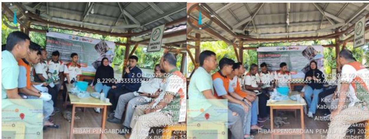
Gambar 6. Sesi Penyampaian Materi Pelatihan Pemanfaatan Abu Bonggol Jagung oleh Tim

Setelah sesi pemaparan materi, Tim juga memberikan praktik langsung dalam proses pembuatan agregat kasar buatan berbahan abu bonggol jagung. Tim memperkenalkan alat dan bahan yang digunakan selama proses pencampuran material. Peserta dibagi menjadi dua kelompok dan masing – masing kelompok diberi kesempatan untuk mencoba secara langsung dalam pembuatan sampel. Selama praktik berlangsung pada Gambar 7, peserta antusias dengan mencoba melakukan tahapan secara benar dan mengajukan pertanyaan apabila masih ada yang belum dipahami dalam proses pencampuran bahan.