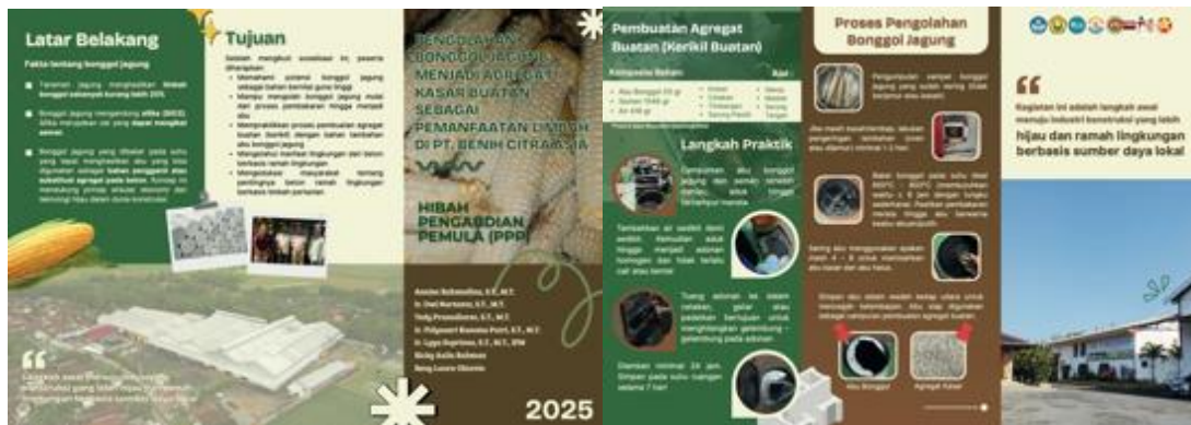
Gambar 5. Materi Pelatihan Pemanfaatan Abu Bonggol Jagung

Tahapan berikutnya yaitu penyusunan materi pelatihan. Materi pelatihan dibuat padat, ringkas dan interaktif (leaflet) untuk memudahkan peserta dalam memahami isi yang disampaikan. Isi dari materi meliputi latar belakang pemilihan bonggol jagung, tujuan pelatihan, komposisi bahan, proses pengolahan bonggol jagung serta pembuatan agregat kasar buatan.