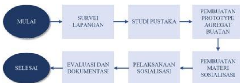
Gambar 1. Metode Pelaksanaan Pengabdian

Kegiatan pengabdian kepada masyarakat berupa pelatihan diselesaikan melalui beberapa tahapan pelaksanaan kegiatan. Adapun tahapan kegiatan yang akan dilakukan dijabarkan pada flow chart di bawah ini.