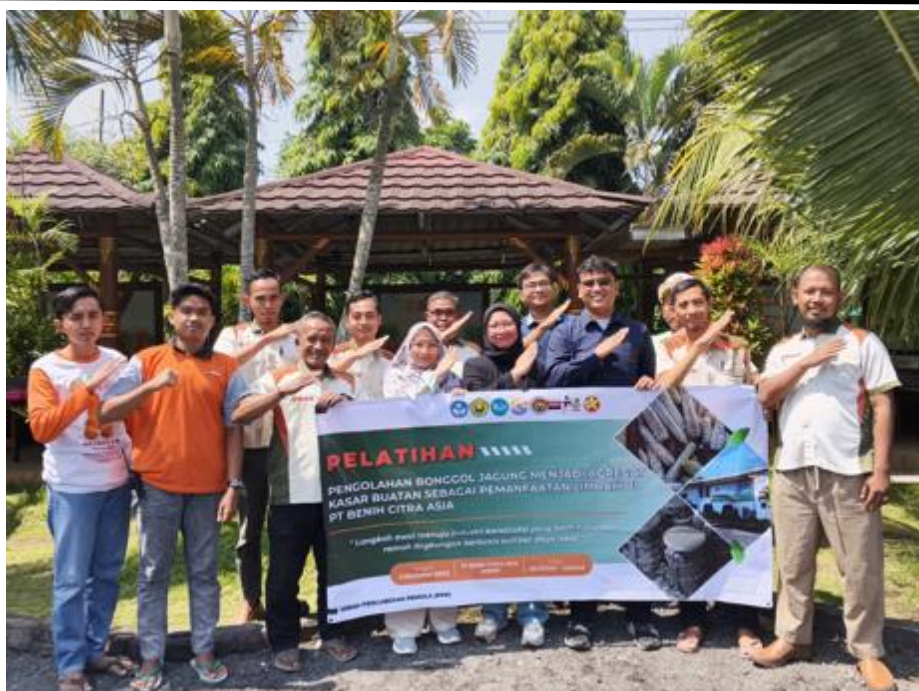
Gambar 9. Dokumentasi bersama Tim dan peserta