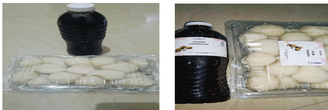
a. Sebelum pelabelan halal