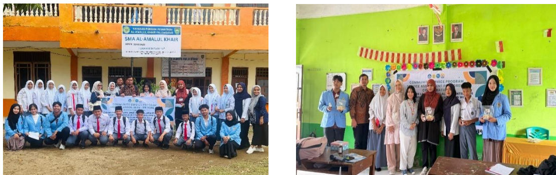
Gambar 2. Aktivitas pengabdian kepada masyarakat

daring melalui Zoom atau Google meeting dalam hal evaluasi label dan produksi pempek yang halal selanjutnya.