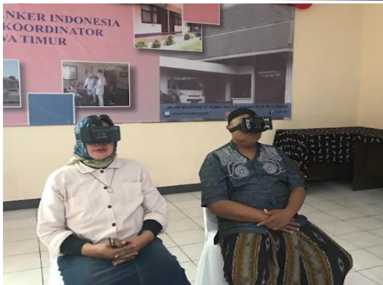
Gambar 1. Kegiatan pendampingan Pasien kanker menggunakan VR