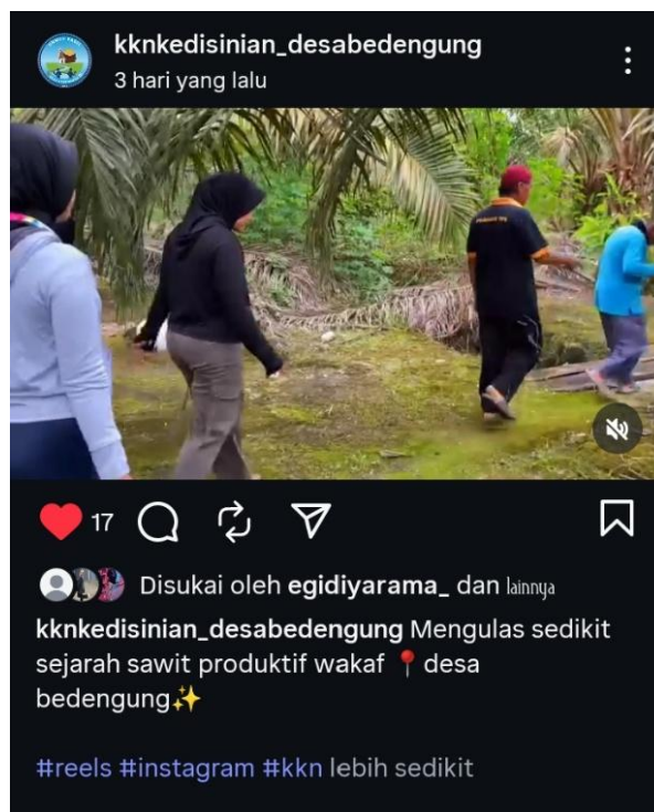
Gambar 3. Publikasi video melalui media sosial

Video promosi wakaf produktif sawit yang telah melalui proses editing akhirnya diluncurkan ke publik melalui beragam platform media sosial, termasuk YouTube, Instagram, dan TikTok. Pemilihan strategi distribusi ini didasari oleh pertimbangan efektivitas, mengingat media sosial memiliki kemampuan menjangkau audiens yang sangat luas dan cepat. Dengan memanfaatkan kekuatan algoritma dan sifat konten yang mudah dibagikan, video tersebut diharapkan dapat meningkatkan visibilitas Desa Bedengung secara signifikan, menarik perhatian tidak hanya dari dalam negeri tetapi juga berpotensi menarik minat dari khalayak internasional.