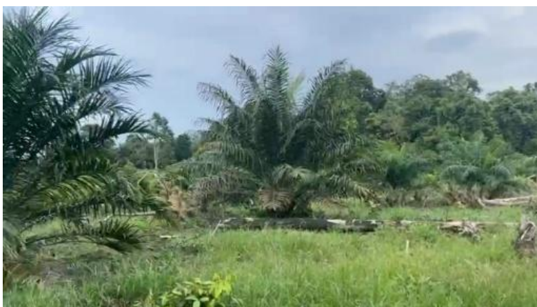
Gambar 2. Pembuatan Video Promosi

Berdasarkan data dan temuan dari observasi lapangan, mahasiswa KKN mulai melakukan eksekusi produksi video promosi. Tahap pertama adalah menyusun naskah dan storyboard yang detail, yang berfungsi sebagai peta alur dan panduan visual untuk keseluruhan video. Naskah dirancang untuk menyampaikan informasi dengan runtut, mulai dari gambaran kondisi kebun, proses pengelolaan oleh masyarakat, hingga potensi ekonomi yang dihasilkan. Storyboard kemudian memvisualisasikan naskah tersebut menjadi adegan demi adegan, memastikan alur cerita lancar dan pesan yang disampaikan tepat sasaran. Perencanaan yang matang ini menjadi kunci agar proses syuting dan editing dapat berjalan secara efisien dan terarah.