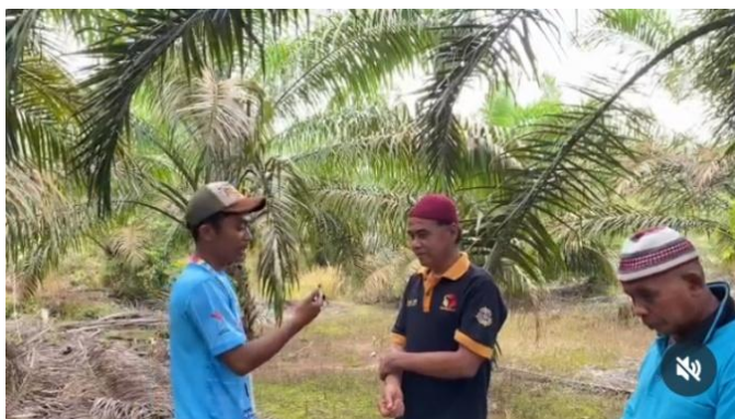
Gambar 1. Observasi dan Pengumpulan Data Lahan Wakaf Sawit

Sedangkan Mahasiswa KKN melakukan observasi langsung ke lokasi lahan wakaf sawit guna memperoleh gambaran yang komprehensif dan akurat. Mereka mengamati secara detail kondisi fisik kebun, mulai dari kesuburan tanaman, infrastruktur pendukung, hingga tanda-tanda kerusakan atau hama. Selain itu, proses pengelolaan harian yang dilakukan oleh masyarakat juga dicermati, termasuk