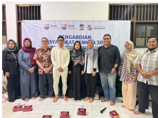
Gambar 3. Sosialisasi dan Edukasi Masyarakat