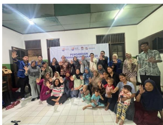
Gambar 4. Sosialisasi dan Edukasi Masyarakat