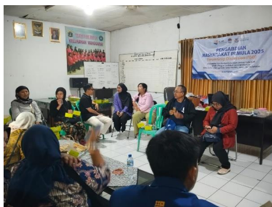
Gambar 1. Wawancara dan Diskusi dengan Pemangku Kepentingan

Wawancara dan diskusi akan dilakukan dengan pemangku kepentingan yang relevan, termasuk pengurus RT/RW, keluarga korban, dan lembaga pendamping jika ada. Semua masukan dari pemangku kepentingan ini akan sangat berharga dalam merancang program yang sesuai dengan kebutuhan dan harapan masyarakat. Diskusi ini juga bertujuan untuk membangun komitmen dan dukungan dari berbagai pihak dalam upaya perlindungan anak (Saimima et al, 2022).