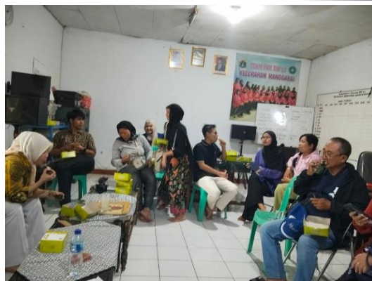
Gambar 2. Wawancara dan Diskusi dengan Pemangku Kepentingan