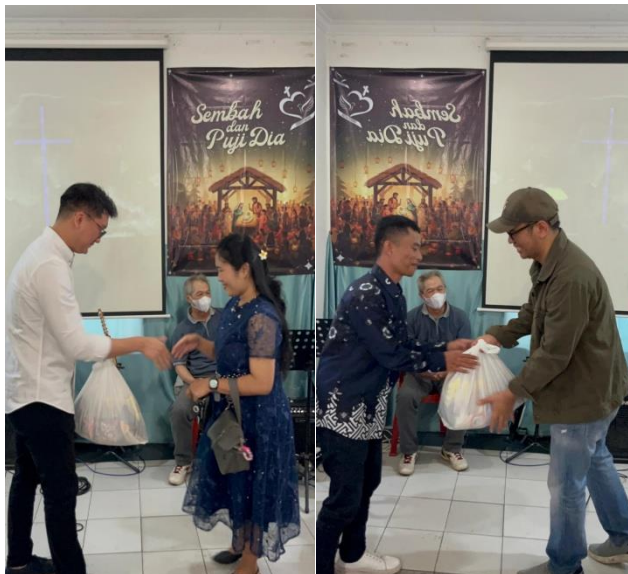
Gambar 1. Pelaksanaan kegiatan