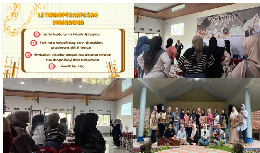
Gambar 2. Sesi Workshop Materi Vokal