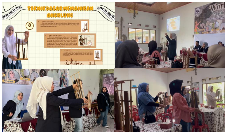
Gambar 1. Sesi Workshop Materi Angklung