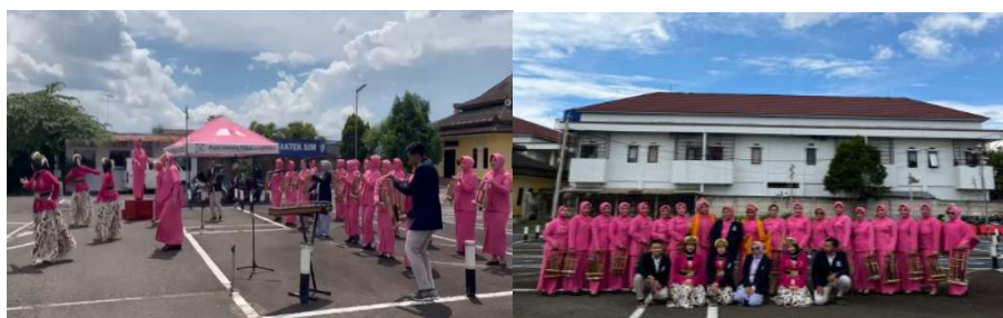
Gambar 6. Pengambilan dokumentasi hasil pelatihan

Program pelatihan ini menghasilkan dampak non teknis yang sangat berharga. Proses latihan yang berbasis kelompok secara nyata meningkatkan interaksi sosial dan memperkuat kerja sama tim. Peserta belajar untuk saling mendengarkan satu sama lain, sebuah keterampilan esensial dalam musik ansambel yang juga relevan dalam kehidupan sehari-hari. Kemampuan untuk mempertahankan harmoni vokal, di mana setiap penyanyi harus fokus pada bagian suaranya (sopran atau alto) sambil tetap menyatu dengan suara lain, secara langsung melatih keterampilan mendengar secara aktif. Keberhasilan dalam mengatasi tantangan teknis ini secara signifikan meningkatkan rasa percaya diri para peserta dalam berekspresi melalui seni. Pelatihan musik berbasis kelompok ini terbukti sangat efektif dalam meningkatkan interaksi sosial, kolaborasi, serta rasa percaya diri peserta, sejalan dengan prinsip pembelajaran musik kolaboratif yang menekankan partisipasi aktif dan kerja sama dalam proses belajar (Kartasmita, 2017) (Campbell, 2018). Selain itu, peningkatan kualitas harmoni kelompok yang terbentuk selama pelatihan sejalan dengan konsep struktur musik yang menyatakan bahwa harmoni dibangun melalui relasi interval nada serta keteraturan bentuk kalimat musik (Prier, 2015).