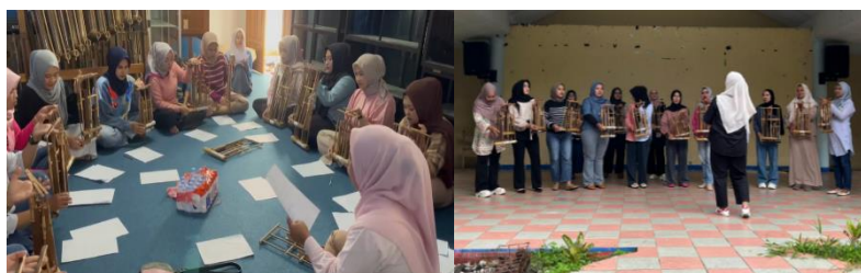
Gambar 3. Sight reading arransemen angklung, Pelatihan terstruktur

Hasil latihan juga menunjukkan bahwa peserta telah memperbaiki aspek konsistensi ritmis dan memainkan angklung dengan tempo yang stabil. Hasil ini mendukung teori pembelajaran musik yang menyatakan bahwa repetisi intensif sangat penting untuk meningkatkan kontrol motorik halus, memori otot, dan koordinasi kelompok dalam permainan grup. Seiring waktu, keterampilan harmoni antara kelompok angklung melodi dan chord juga meningkat. Konsep struktur musik menghubungkan proses harmonisasi dengan pembiasaan interval nada dan penguatan persepsi tonal dalam musikal (Prier, 2015).