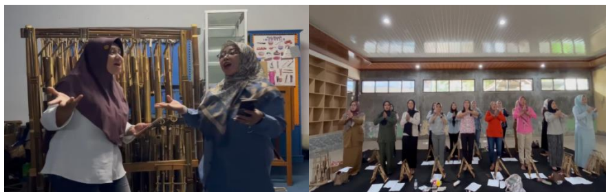
Gambar 5. Pelatihan Terstruktur Vokal, Latihan pembagian suara dan Latihan terstruktur dengan koreografi

dimensi ekspresif pada penampilan vokal peserta dan meningkatkan kualitas musikal secara keseluruhan. Tahap akhir pelatihan adalah pengembangan interpretasi lagu melalui pendekatan artistik yang lebih luas. Peserta mempelajari koreografi pendukung untuk memperkuat pesan musikal. Pendekatan ini dirancang agar penampilan tidak hanya menyampaikan lagu melalui lirik dan nada saja, tetapi juga melalui ekspresi gestural yang relevan. Unsur gerak tubuh dapat membantu peserta mengekspresikan karakter budaya, emosi, dan pesan yang terkandung dalam lagu sehingga penampilan menjadi lebih hidup dan komunikatif. Secara keseluruhan, tahapan pelatihan vokal ini menunjukkan kemampuan peserta yang berkembang signifikan, baik dalam aspek teknik vokal, stabilitas harmoni, pemahaman musikal, maupun interpretasi artistik. Latihan terstruktur berbasis pembagian suara, repetisi, dan teknik ngabeo menjadi fondasi utama dalam keberhasilan peserta menguasai kedua lagu pada garapan paduan suara.