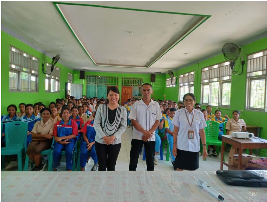
Gambar 6. Pelaksanaan Sosialisasi