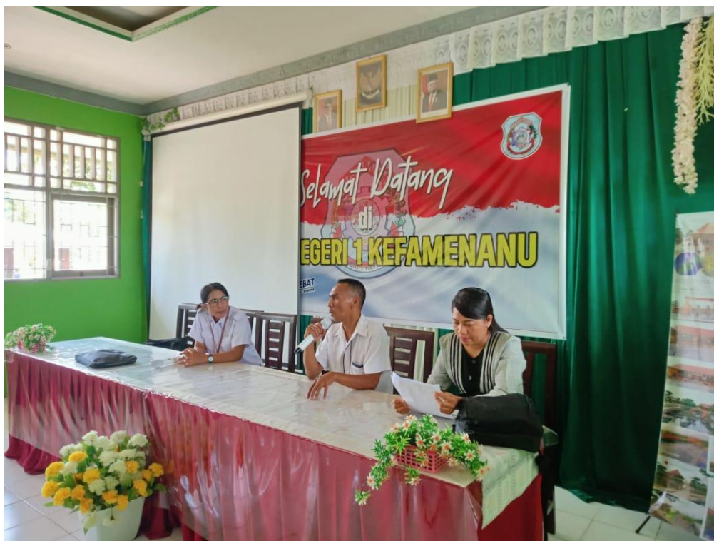
Gambar 5. Pelaksanaan Sosialisasi

Kegiatan sosialisasi dilakukan sesuai dengan kesepakatan mitra yaitu pada tanggal 30 januari 2024, pukul 09.00 wita di aula SMKN 1 Kefamenanu dan diikuti oleh 139 siswa (bukti terlampir pada gambar 7 Daftar hadir peserta). Kegiatan yang dilakukan berupa sosialisasi mekanisme pendaftaran SNPMB dan pendampingan pendaftaran Kartu Indonesia Pintar (KIP).