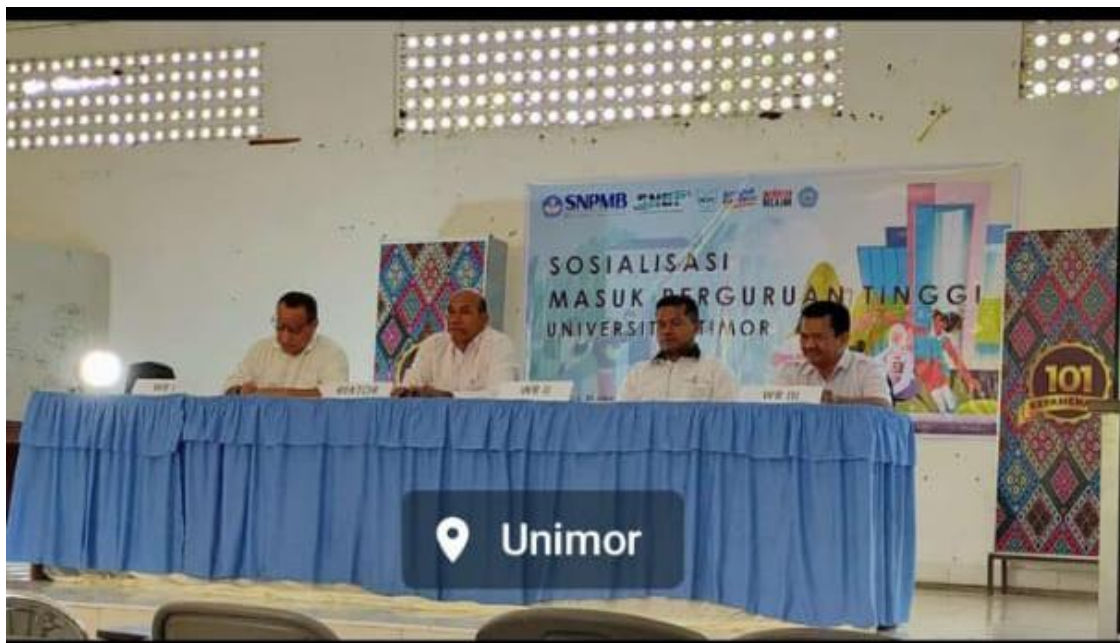
Gambar 4. Rapat Internal Tim Sosialisasi