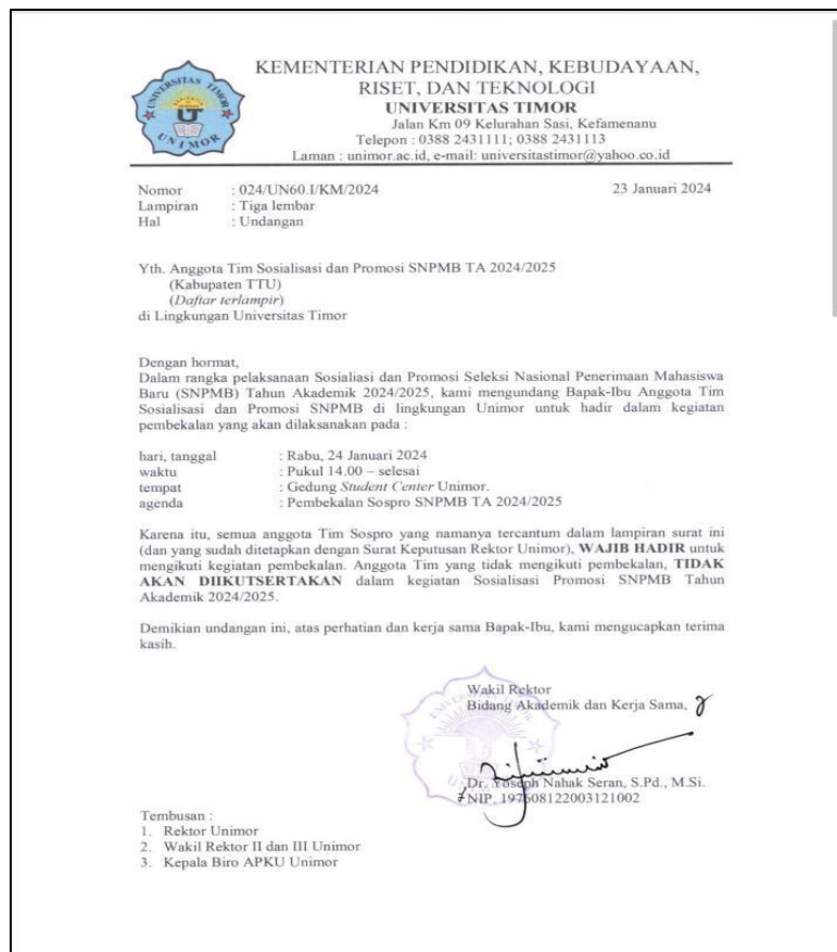
Gambar 3. Undangan Rapat Internal